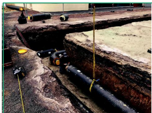
Pose de tuyaux adaptés au nouveau réseau de chauffage urbain

Dans le même temps, la Ville de Béthune se dote d'une nouvelle chaufferie moderne et équipée de 3 chaudières mixtes (gaz naturel / gaz de mine) et d'une cogénération au gaz de mine. Cette chaufferie est implantée dans le quartier du Mont-Liébaud.